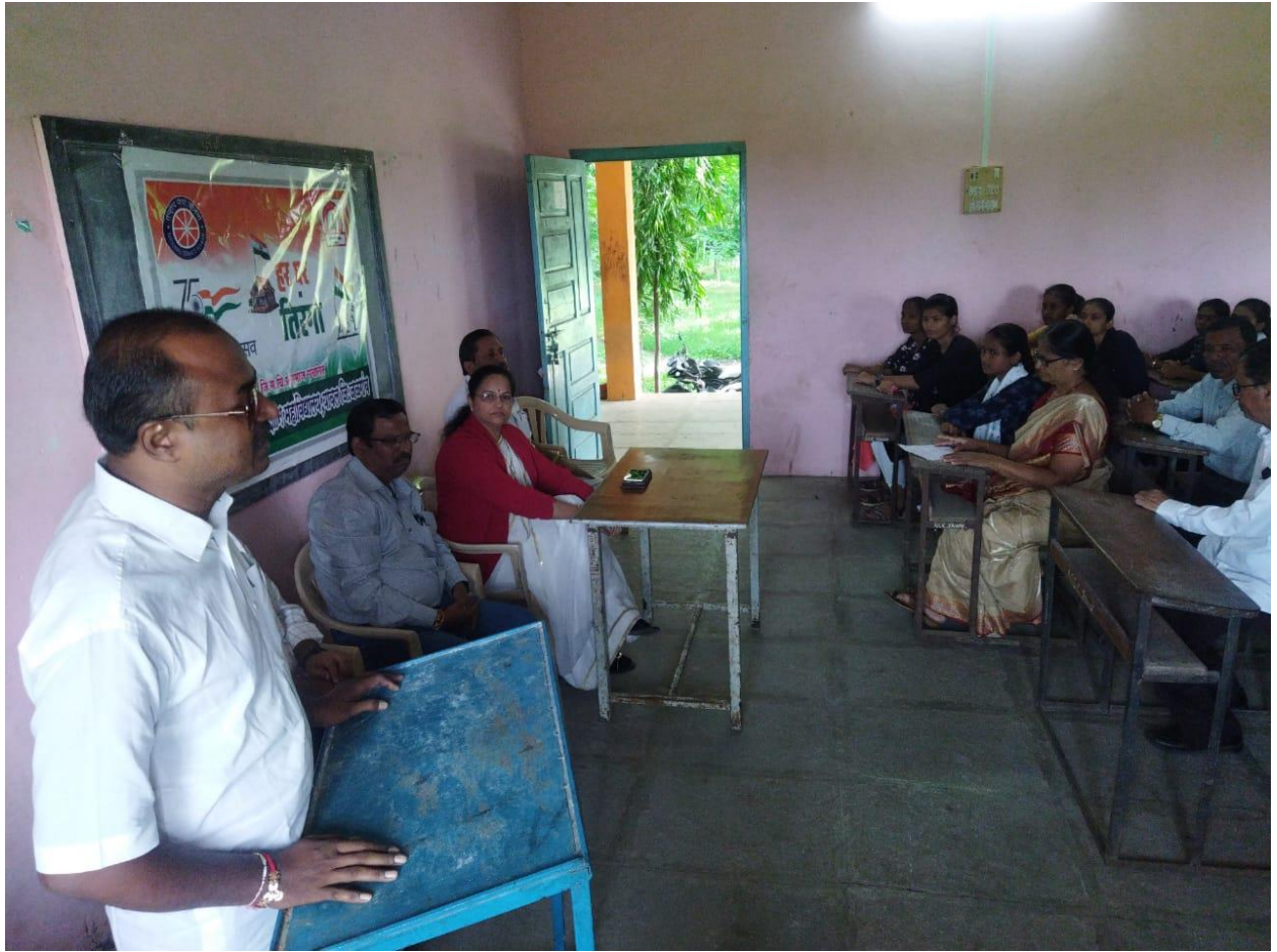
India' divination Day Programme