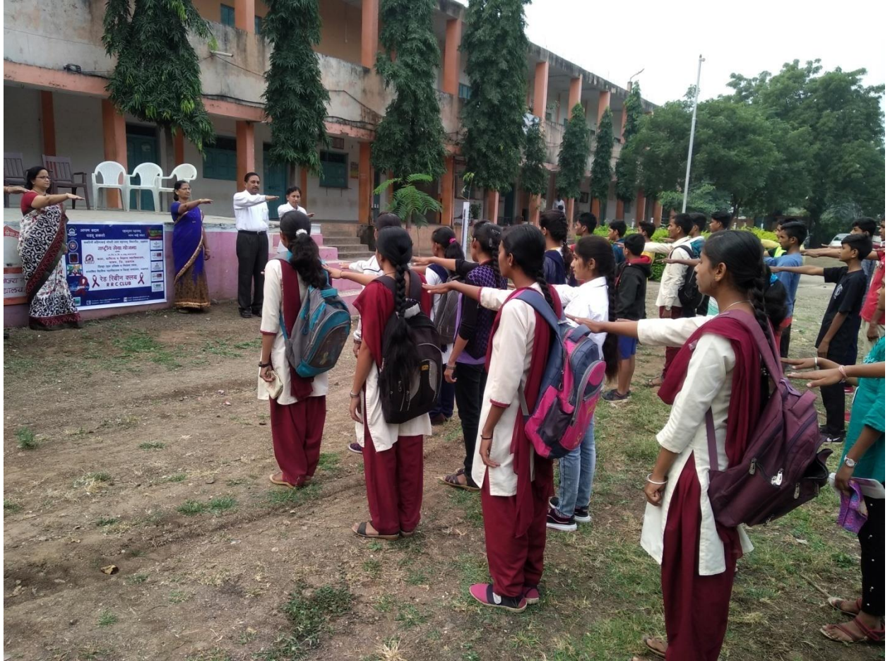
AIDs Oath in collaborations with Red Ribbon club