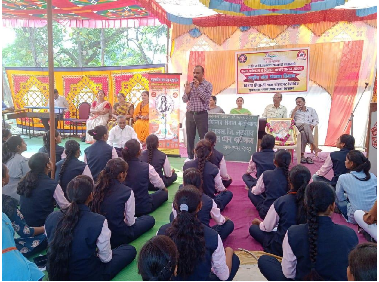
SahajYog Dhyana Workshop