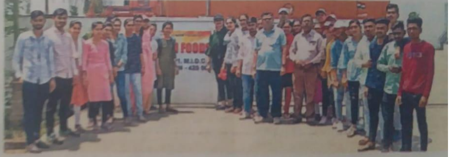
औद्योगिक सहलीतून कंपनीत जाऊन माहिती घेणारे यावल महाविद्यालयाचे विद्यार्थी व प्राध्यापकवृंद.

उद्योगाची उभारणी किंवा उद्योग सुरुवात करणे म्हणजे, त्यासाठी काय आणि किती मोठेवट संपत्ती, उद्योग कार्यासाठी काय प्रयत्न करावे लागतात, त्यासाठी कोणते निवेदन करावेत, अदी माहिती विद्यार्थ्यांनी उद्योगात जाऊन घेतली. हा