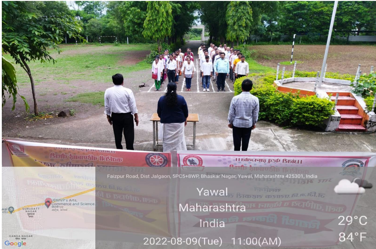
Rashtragan Amrit Mahotsav

7.1.4 Institutional efforts in providing an inclusive environment i.e. tolerance and harmony toward cultural regional , linguistic , communal, socioeconomic diversity and sensitisation of student and employs to the constitutional obligations: