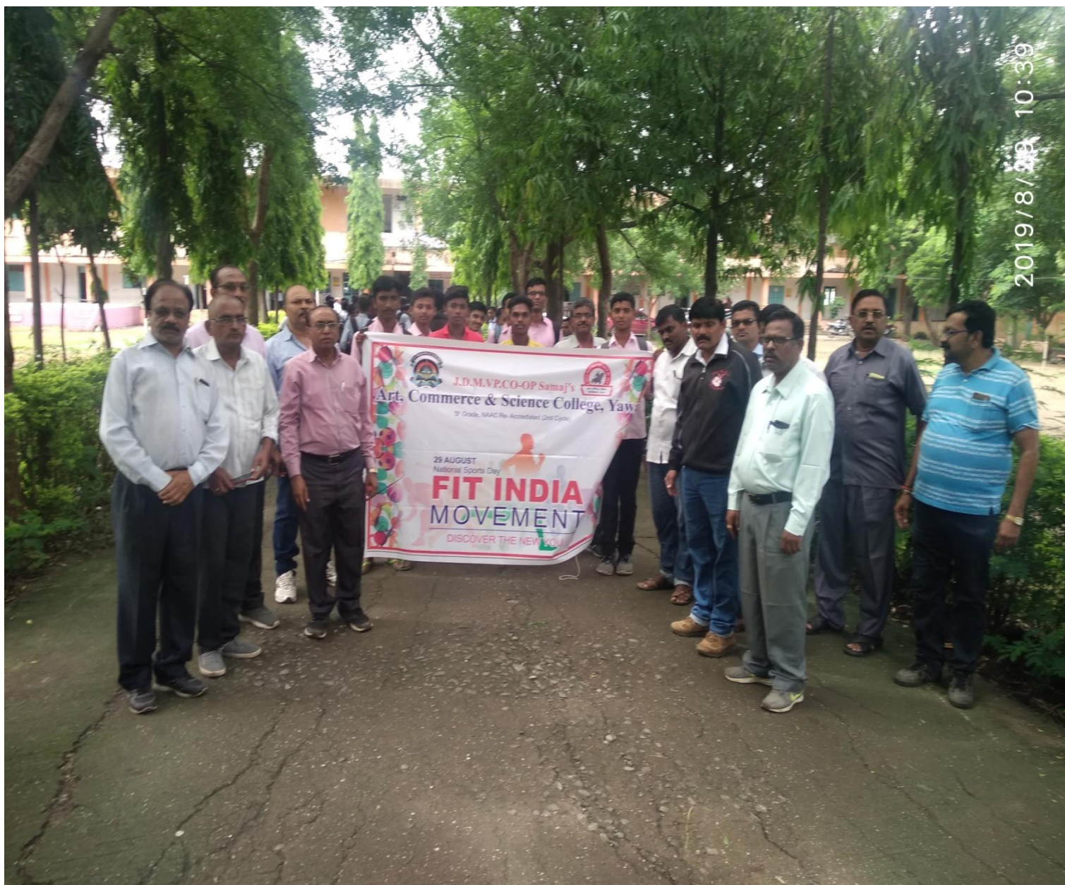
Fit India Movement