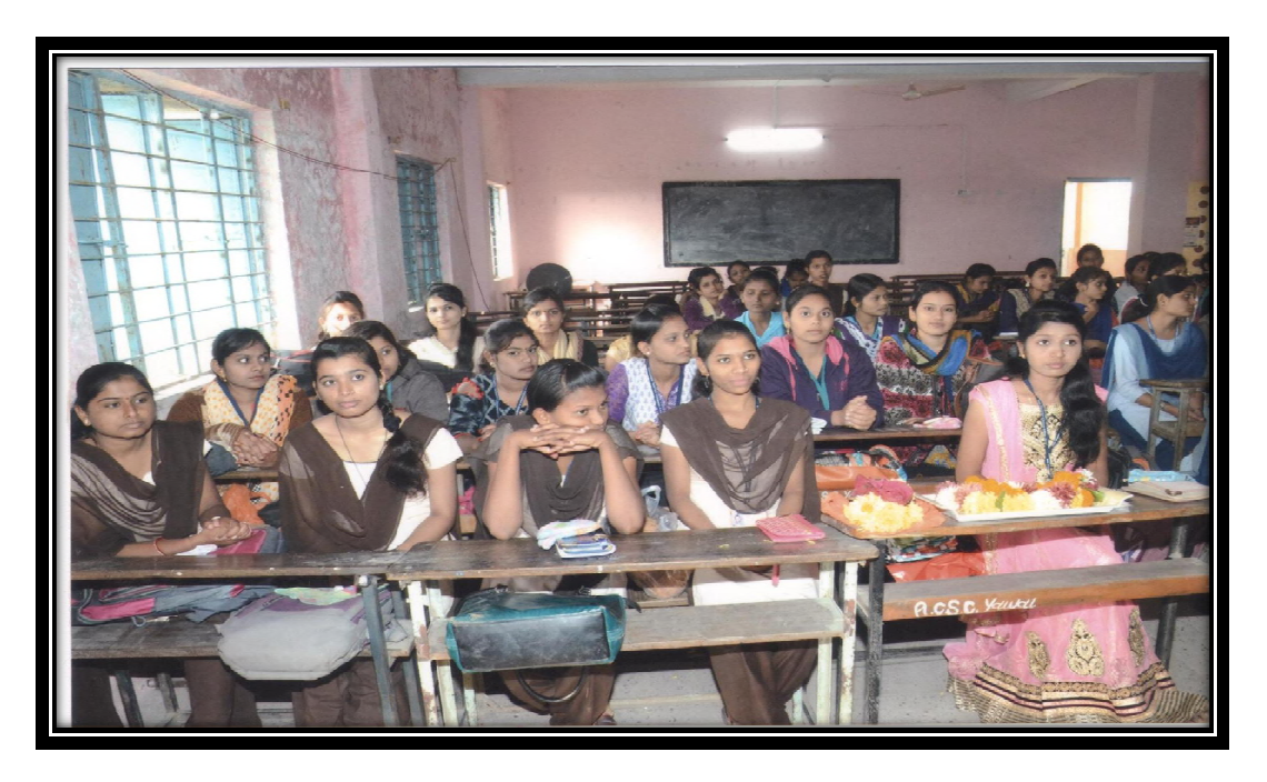
Girls (Student) Participation in Personality Development Workshop