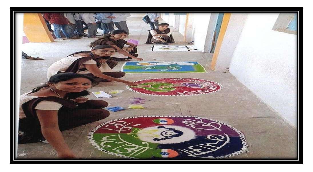
Student Participation in Rangoli Competition